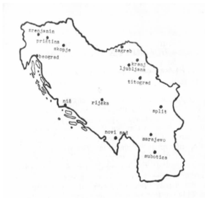
Prilog 1: „Мапа Чаробњака из Оза“ (preuzeto iz Туцић 1983: 91).

Ne govori ovaj Tucićev tekst samo rečima, već – kao i bilo koji drugi Tucićev artefakt – progovara, u svojoj kadenci, i slikom. Reč je zapravo o vizuelnom „citu“ jedne dečije intervencije izvršene nad „nemom“ kartom SFRJ, na koji ćemo se i sami osloniti u ovoj našoj književnoistorijskoj prilici (vidi Prilog 1 ):