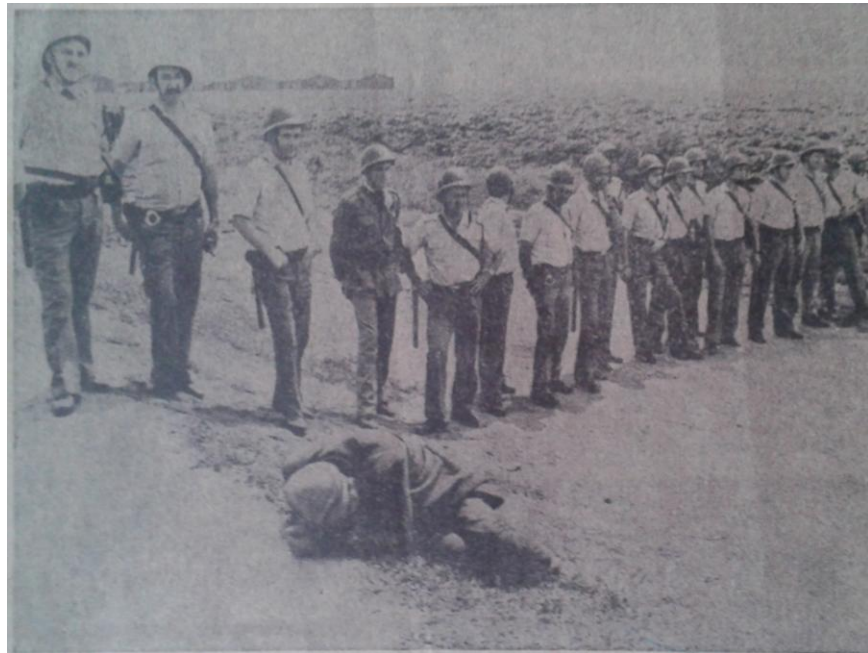
Слика 2 „Без речи“

Међутим, из политичких разлога награда није уручена аутору, а ТАНЈУГ више није организовао оваква такмичења (стр. 2).