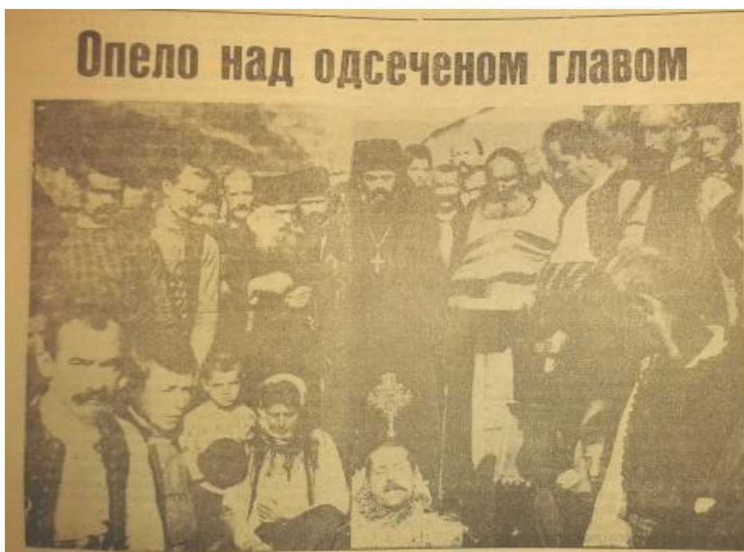
Слика 3: „Опело над одсеченом главом“

Тако на пример, у броју 453, од 01. 03. 1986., на страни 10, снимљен је један упечатљив детаљ, тачније слика, са пропратним текстом и насловом Опело над одсеченом главом .