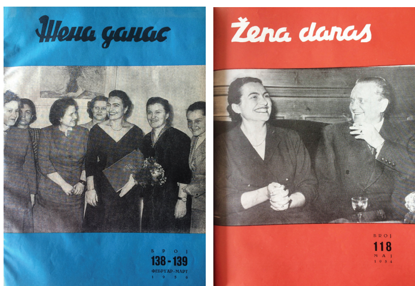
Slika br. 2 i 3: Naslovne strane časopisa Žena danas (februar–mart 1956. i maj 1954)

političkog i društvenog položaja žena i ostale probleme u vezi sa ovim smatram da treba da se tretiraju kroz ostale stranice na kojima se piše o pitanjima našeg unutrašnjeg života, jer ovo kao što je poznato, nisu neki posebno ženski problemi, nego zajednički problemi čitavog našeg društva i kao takve ih treba i tretirati kroz štampu.” 98 Jedan od glavnih argumenata za ukidanje AFŽJ, 1953, bio je baš ovaj, da su žene dobile sva politička i socijalna prava i da se njihov status sada ne treba posmatrati izolovano od položaja ostalih članova društva, te stoga nije potrebno ni postojanje ženske političke organizacije. 99 Prema pisanju novinarkе, Jovanka Broz je takođe primetila kako se smanjio broj politički aktivnih žena, što je povezala s manjim brojem kandidovanih i izabranih žena na poslednjim izborima. 100 Aleksandar Ranković je na Četvrtom plenumu CK SKJ, održanom marta 1954, detaljno govorio o problemu osipanja žena u SKJ. 101