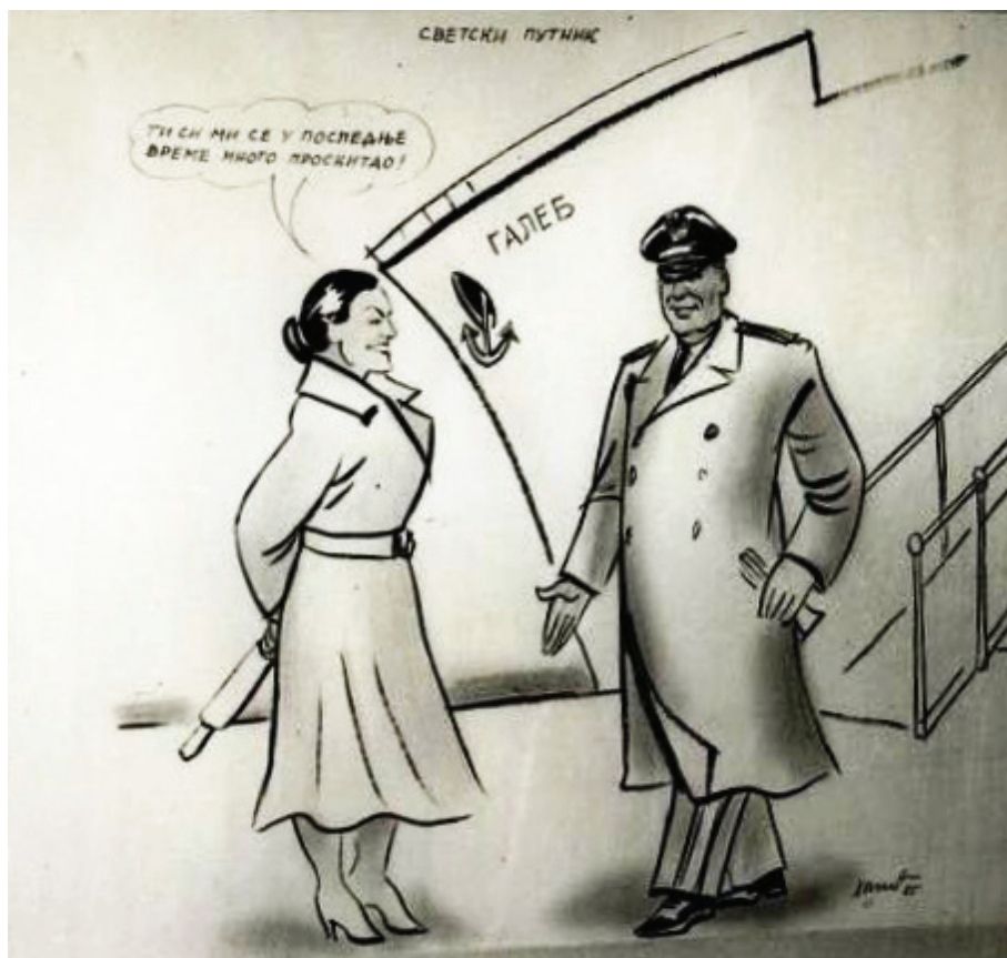
Slika br. 6: Karikatura Svetski putnik (Muzej istorije Jugoslavije)

Karikatura iz 1955. godine, nastala samo tri godine posle venčanja, aludira na Brozova česta putovanja i eventualan Jovankin stav prema tome. Interesantno je, kako je već ranije istaknuto, da Jovanka Broz u to vreme još nijednom nije pratila Tita na nekom zvaničnom putovanju u inostranstvo. 321