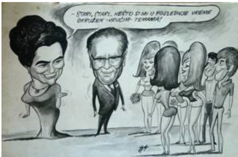
Slika br. 8: Karikatura bračnog para Broz (Muzej istorije Jugoslavije)

Nažalost, ni godina ni autor ove karikature nisu poznati, ali sadržaj navodi na zaključak da datira iz sedamdesetih godina, pošto se sasvim uklapa u kontekst toga vremena i problema koje je bračni par, sudeći prema kasnije objavljivanim memoarima ali i arhivskoj građi, tada imao. U taj period smeštena su sećanja na dolazak fizioterapeutkinja u Brozovo okruženje, te Jovankinu navodnu paranoidnu ljubomoru, kao i njihovu konačnu rastavu. Na karikaturi su oboje predstavljeni dosta starije nego na onoj iz 1955, ali i u odnosu na karikaturu iz 1969, pa i to može biti jedan od pokazatelja da je ova poslednja nastala sedamdesetih godina 20. veka. 323