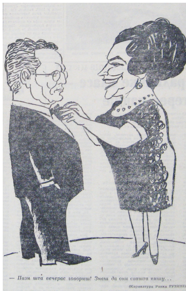
Slika br. 7: Karikatura Ranka Guzine ( Borba , 20. februar 1969, str. 7)

Ova karikatura, nastala 1969, izašla je u Borbi , povodom Titove posete proslavi obeležavanja godišnjice lista. Blaga kritika javnog diskursa tj. novinara na ovoj karikaturi, uklopljena je u tekst koji se nalazi u centralnom delu novina, zauzima dve strane i naravno govori o toj Brozovoj poseti i proslavi, a Jovanka se spominje samo u nekoliko rečenica gde se govori o poklonima koje je bračni par Broz dobio od članova Borbine redakcije. 322