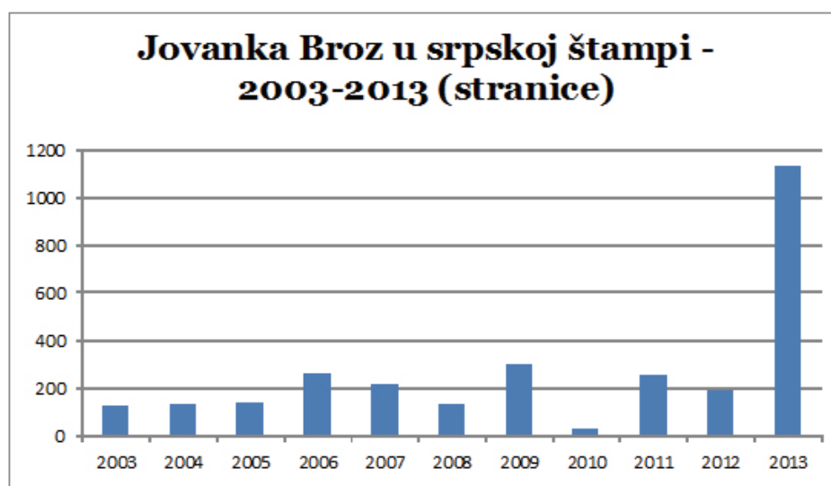
Grafikon br. 1: Jovanka Broz u srpskoj štampi 2003–2013.