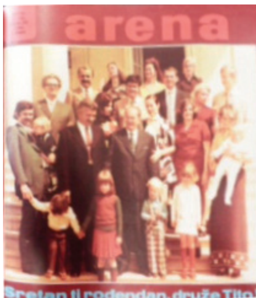
Slika br. 4: Naslovna strana časopisa Arena (maj 1975)

Da je 1975. godine bilo velikih problema u braku Brozovih, javnost je mogla još i tada da se u to uveri. U zagrebačkom listu Arena , na naslovnoj strani, a u čast Titovog rođendana, 25. maja 1975. štampana je porodična fotografija sa proslave rođendana prethodne 1974. godine. Interesantno je da se na njoj nalazi čitava porodica, deca, unuci, unuke, praunuci, praunuke ali ne i Jovanka Broz! 263